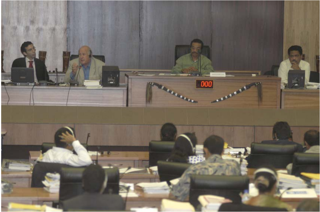
Señor Francisco gurerres "Lu Olo", Prezidente Parlamentu Nasional Timor-Leste