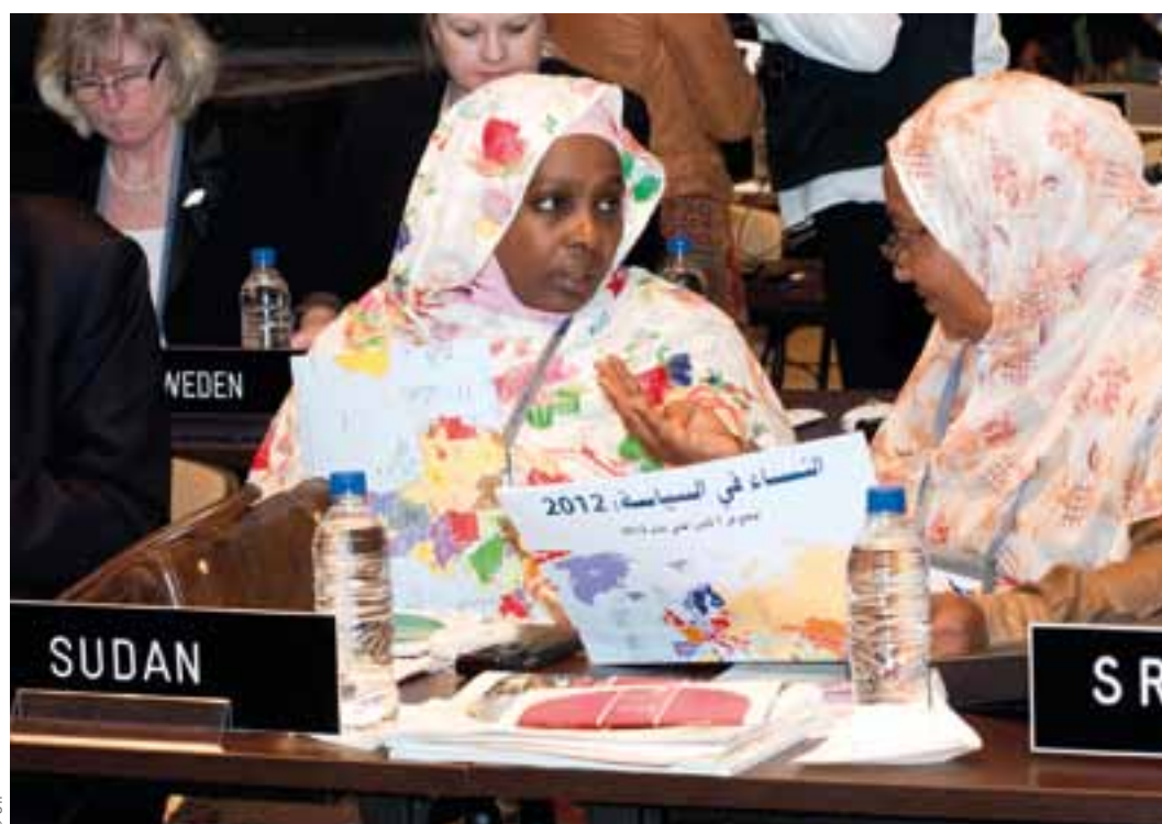
Réunion des Femmes parlementaires, 128 e Assemblée de l'UIP, Quito, Equateur, mars 2013.

↳ La communication , interne et externe, est essentielle. Des canaux de communication clairs doivent exister à l'intérieur du forum afin que les idées puissent circuler librement et que tous les membres soient informés. Il faut également que les forums de femmes parlementaires réfléchissent à la façon dont ils feront connaître leur travail et communiqueront avec les autres parlementaires et les autorités de leur parlement. Sur le front extérieur, il faut qu'ils dialoguent avec la société civile et le grand public. Certains forums ont élaboré un plan de communication leur permettant de cibler leurs efforts et de déterminer les flux d'information. Vous trouverez dans la base de données en ligne de l'UIP des exemples de plan de communication de forums de femmes parlementaires ( www.ipu.org/wmn-f/caucus ).