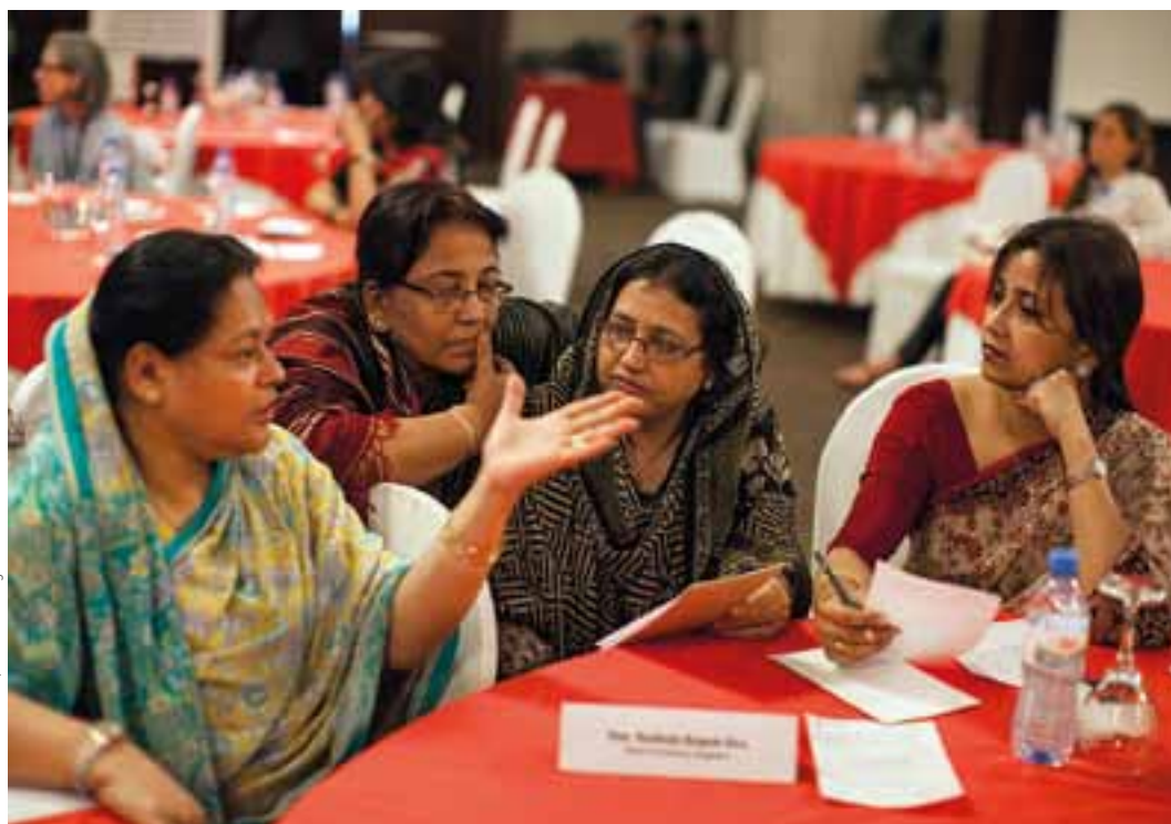
Première réunion du Réseau de femmes parlementaires d'Asie du Sud, Sri Lanka, 2013.

Au Pakistan , les recherches menées par le Caucus de femmes parlementaires pour connaître le sort des femmes victimes de brûlures à l'acide et savoir quelles sont les structures médicales aptes à les soigner ont contribué à sensibiliser la population à ces atrocités 78 . Ces efforts ont permis de financer des unités de soin des grands brûlés dans les hôpitaux régionaux 79 . Le Caucus des femmes parlementaires a aussi contribué à réformer la police en se rendant dans des commissariats de femmes et en rendant ses conclusions publiques. Parmi les recommandations formulées pour améliorer l'efficacité des commissariats, le groupe a plaidé en faveur d'une augmentation du salaire des femmes policiers, ainsi que de la mise à disposition de moyens de transport et de logements 80 .